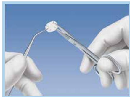
Preparación de una membrana BioMend para su colocación en la cavidad del seno maxilar.

Soporte suficientemente rígido para la regeneración del tejido en procedimientos de regeneración tisular y ósea guiados.