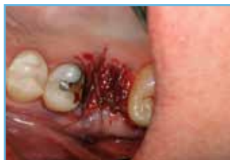
5. Suturas colocadas para cerrar el sitio quirúrgico.