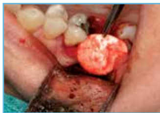
2. Preparación de la membrana para su colocación.