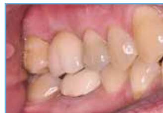
6. Resultado estético final.

Los resultados individuales pueden variar.