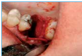
4. Membrana colocada en el alvéolo.