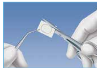
3. Membrana recortada para su colocación.