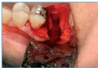
1. Defecto en la cortical vestibular del diente n.º 3.